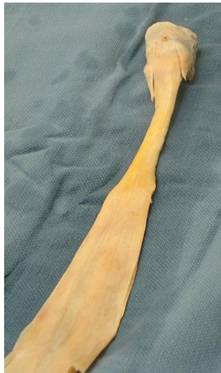
Sener Død donor